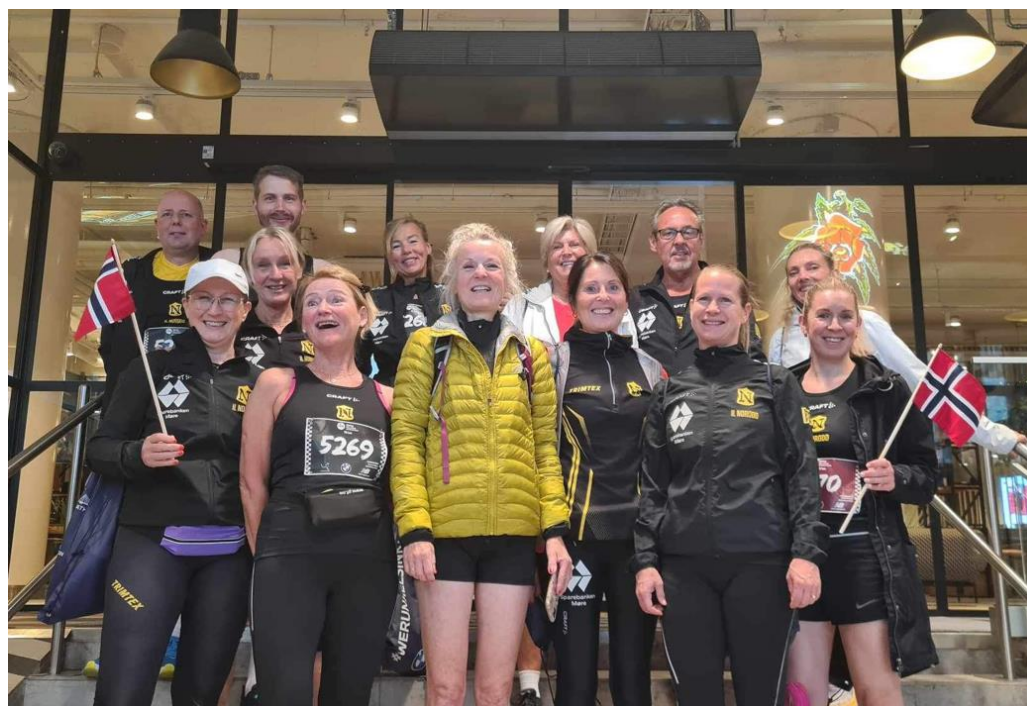
Helsinki 19. august 2023