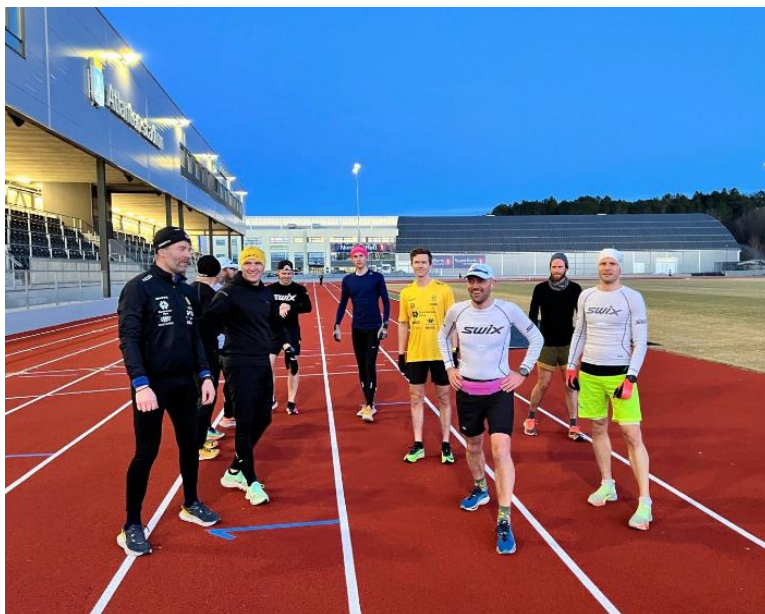
RFF 10-km gruppa intervalltrening

Uansett om målet er å komme i form, perse eller vinne, så er det plass til og rom for alle i Run for Fun som en arena for å ha det kjekt og sosialt med løping som fellesnevner.