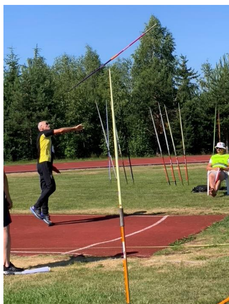
Hika med sitt lengste kast.