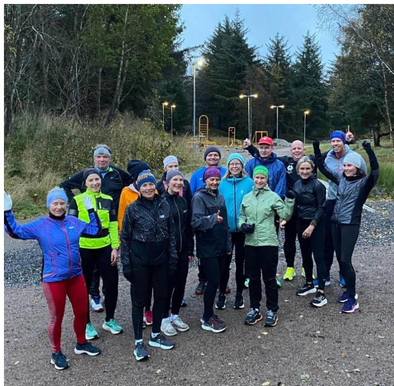
Intervallgruppa i Folkeparken 17.10.23