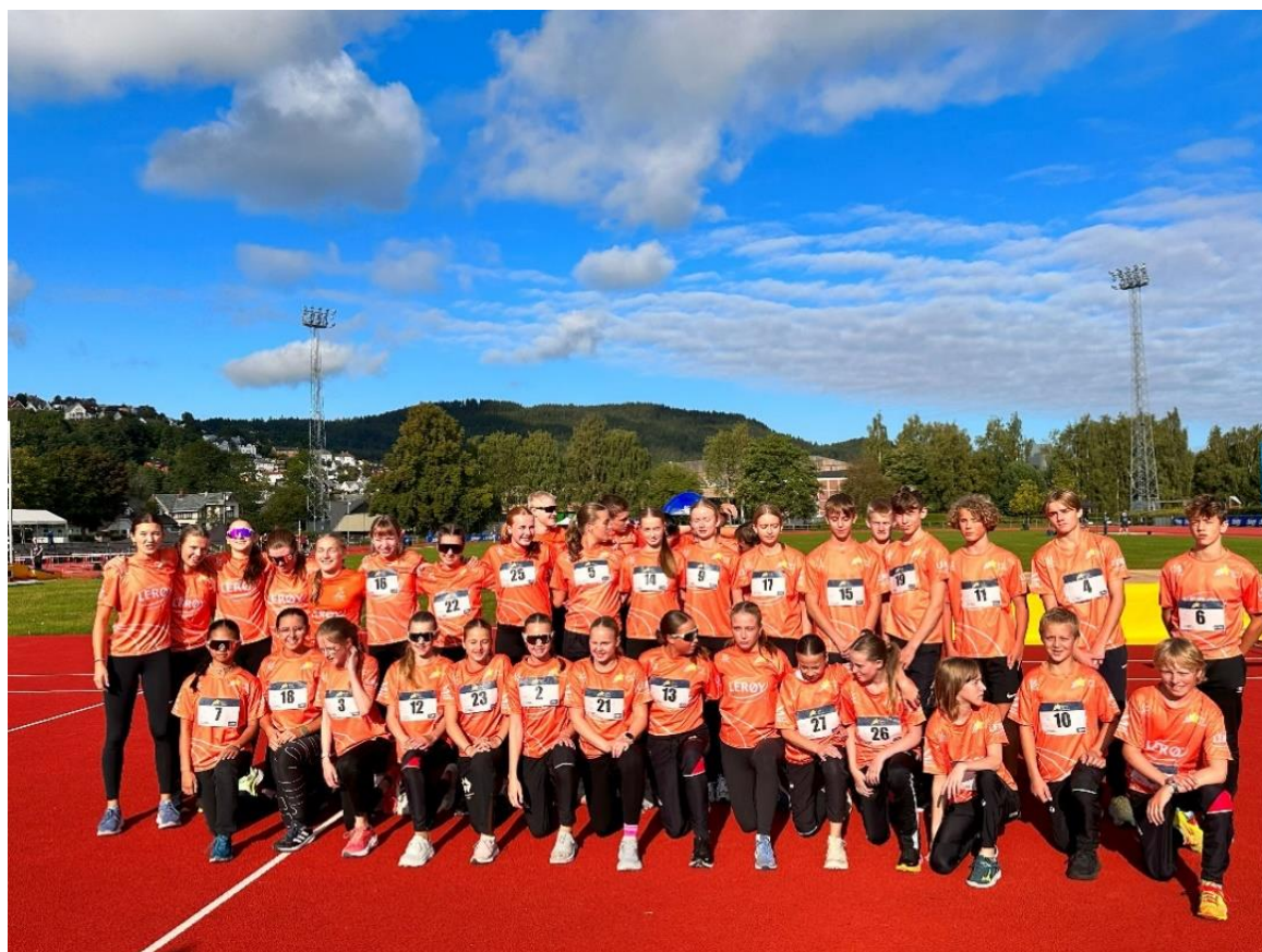
Lerøylekene i Trondheim 2023

Nå ser vi fram mot neste sesong med både stafetter og stevner på egen bane. Og for ikke å snakke om å slippe å reise bort for å øve på både løp og hopp.